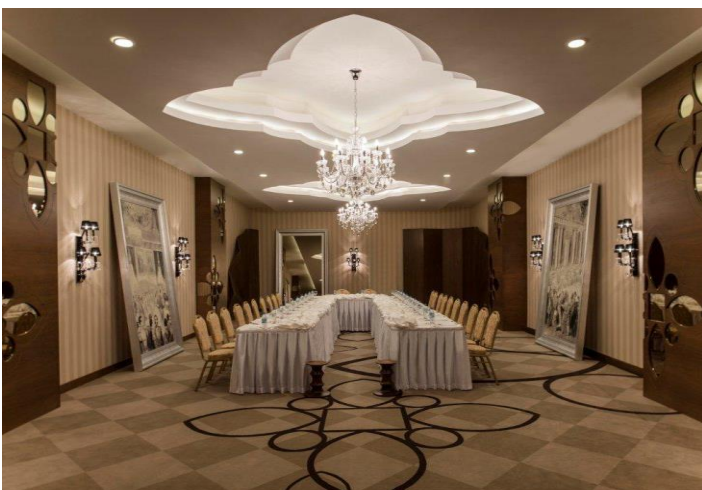
U – Form