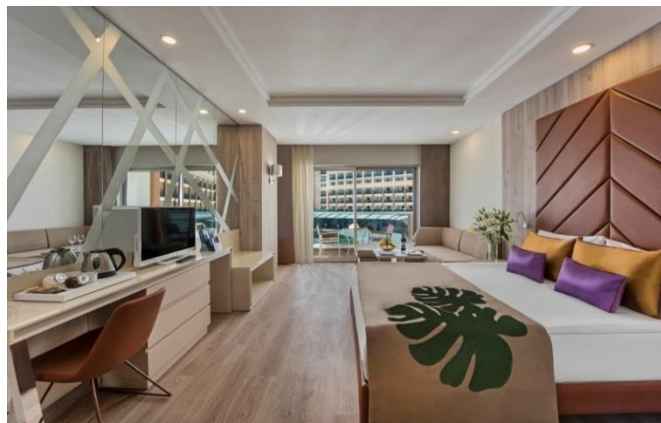
BE Family A