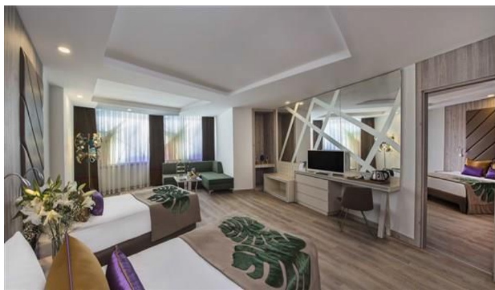
BE Family B