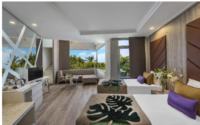
BE Family Loft

BE FAMILY A: insgesamt 110 Zimmer, jedes Familienzimmer ist 56 m 2 und besteht aus 2 Zimmer. Im Elternzimmer gibt es 1 Frenchbett, 1 Sofa, Im Kinderzimmer gibt es 2 Singlebetten (Maximale Unterkunft 4+1 oder 3+2). Die Zimmer verfügen über Balkon, 1 Dusche / WC, Klimaanlage (zentral und stundenweise), Haartrockner, Direktwahltelefon, LCD Fernsehen (Sat Empfang), Musikempfang, Safe, Minibar, Laminatboden, Wasserkocher, Tee und Kaffee. Jeden Tag Zimmerreinigung und Wechsel von Badetuch. Wechsel von Bettlaken jeden zweiten Tag einmal. Zimmerlage als seitlicher Meerblick. Schlafsofa: 160x80 cm.