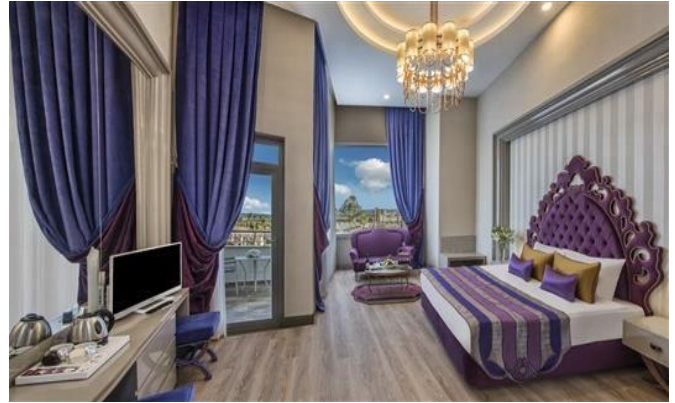
BE Delux Loft

BE ROMANTIC: insgesamt 56 Zimmer, jedes Zimmer ist 32 m 2 . In jedem Zimmer gibt es 1 Frenchbett (Unterkunft maximum 2 Erwachsene). Die Zimmer verfügen über Balkon, Dusche / WC, Klimaanlage (zentral und stundenweise), Haartrockner, Direktwahltelefon, LCD Fernsehen (Sat Empfang), Musikempfang, Safe, Minibar, Laminatboden, Wasserkocher, Tee und Kaffee. Jeden Tag Zimmerreinigung und Wechsel von Badetuch. Wechsel von Bettlaken jeden zweiten Tag einmal. Zimmerlage als Landseite oder seitlicher Meerblick.