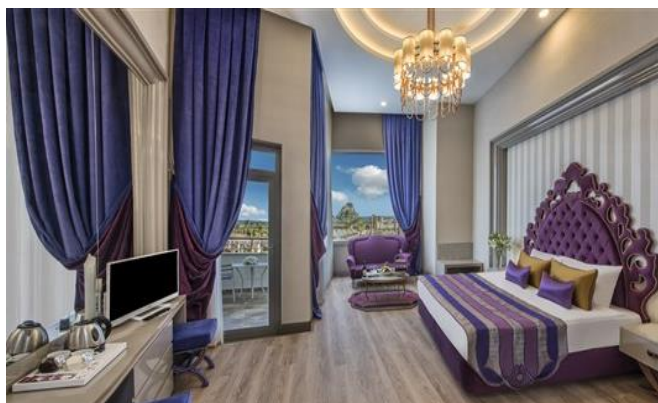
BE Delux Loft

BE ROMANTIC: insgesamt 56 Zimmer, jedes Zimmer ist 32 m 2 . In jedem Zimmer gibt es 1 Frenchbett (Unterkunft maximum 2 Erwachsene). Die Zimmer verfügen über Balkon, Dusche / WC, Klimaanlage (zentral und stundenweise), Haartrockner, Direktwahltelefon, LCD Fernsehen (Sat Empfang), Musikempfang, Safe, Minibar, Laminatboden, Wasserkocher, Tee und Kaffee. Jeden Tag Zimmerreinigung und Wechsel von Badetuch. Wechsel von Bettlaken jeden zweiten Tag einmal. Zimmerlage als Landseite oder seitlicher Meerblick.