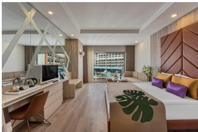
BE Family A