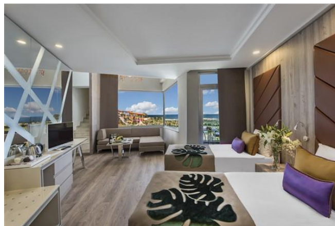
BE Family Loft