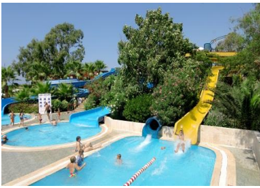
Kaydırak Havuzu 1