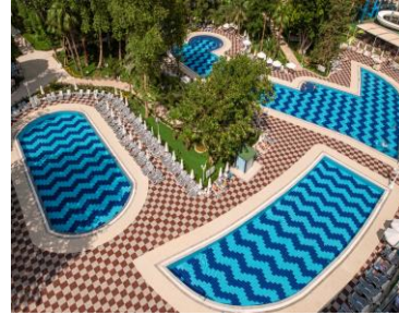
Havuz 3 (üst sol), 4 (orta), 5 (üst sağ)