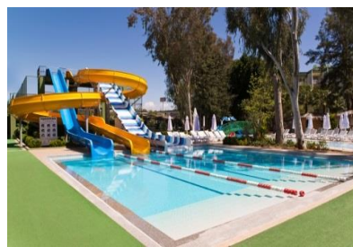
Kaydırak Havuzu 2