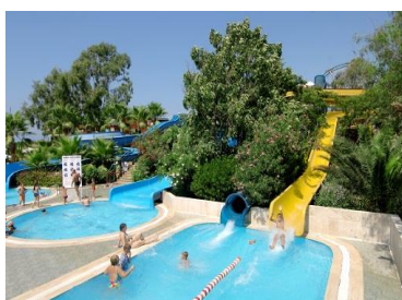
Aqua Pool 1