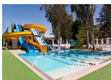
Aqua Pool 2